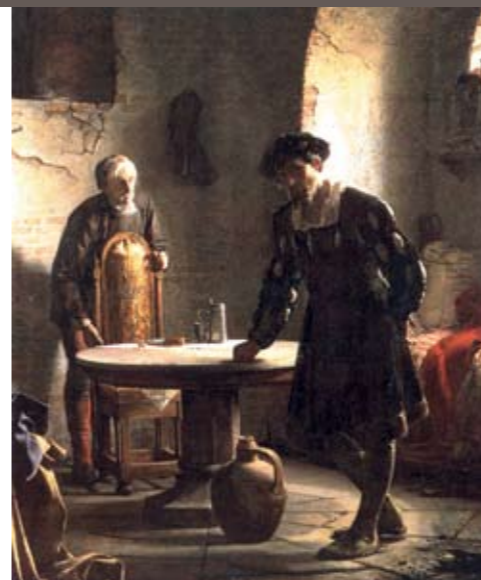
Christian den 2. i sit fangenskab på Sønderborg Slot.

Restaurant M Store Kongensgade 56 Tlf. 33 15 85 77 www.restaurant-m.dk Man-lev 11:30-16:00 Åbningstiderne udvides gerne til private selskaber. Vi leverer også ud af huset.