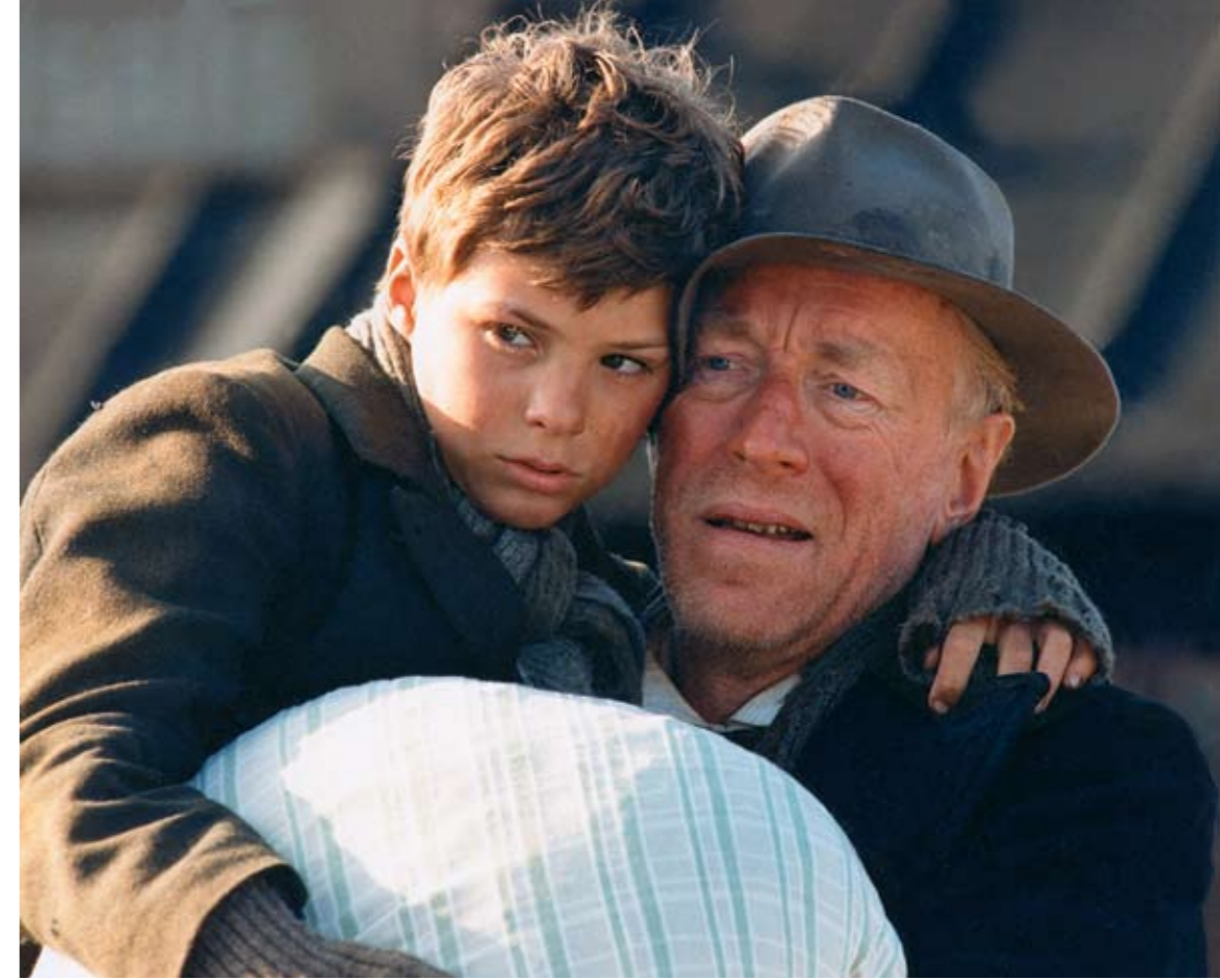
Billedet fra Pelle Erobreren som med tiden er blevet kendt over hele verden.

Hvis vi taler udland, kan jeg nævne Kenneth Branagh, som jeg arbejdede med først som skuespiller på ”Othello”, og så på to film med ham som instruktør, ”Hamlet” og den film, han lavede sidste år, Mozarts ”Tryllefløjten”. Jeg har arbejdet med så mange, men det er svært for mig at sætte navn på det, jeg synes var bedst, fordi det allsammen har været store oplevelser.”