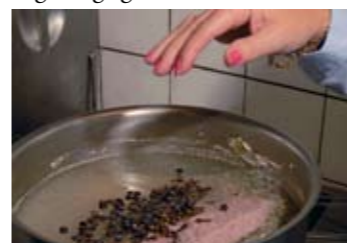
Krydderierne tilsættes kødet.

Et par gange om måneden lagde Bahs og Balling vejen forbi Kanal-Cafeen for at indtage Ingeborgs gode smørrebrød.