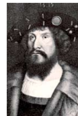
Christian den 2.

af universitetet, fordi han forsømmer sine pligter ved gudstjenesten i Vor Frue Kirke. I mere eller mindre opløst tilstand oplever han middelalderbyen København, sådan at læseren