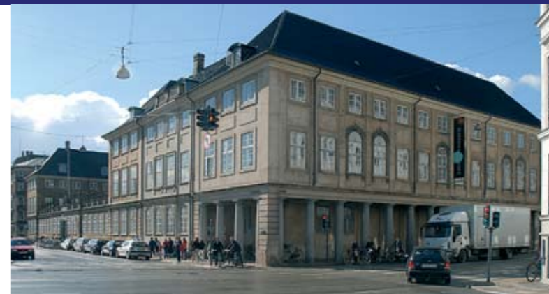
Prinsens Pale som er facaden ud mod Frederiksholms Kanal.

delt på to udstillinger, og dertil Antiksamlingen, Etnografisk Samling og Møntsamlingen, samt endelig Børnenes Museum. I 2008 kommer så oldtidsudstillingen.”