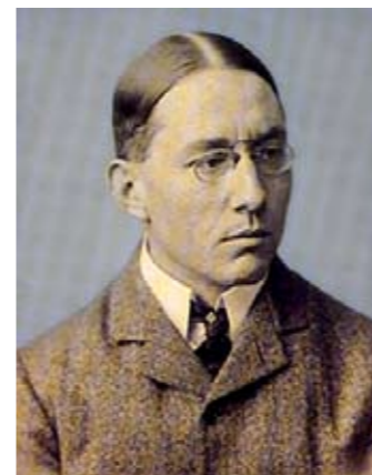
Johannes V. Jensen som ung.

”Kongens Fald” er en af de helt store romaner i dansk litteratur – først og fremmest i kraft af sit sprog. En tour de force uden lige fra nobelpristageren Johannes V. Jensens hånd.