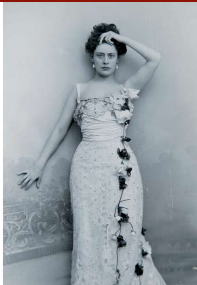
Betty Nansen i en fantastisk rolle som Kameliadamen.

I 1884 ændrede tingene sig; familien flyttede til København, hvor forældrene fik arbejde på Dagmar-teatret, og Betty kom i N. Zahles skole. Men teatret sad dybt i hende, og 19 år gammel gik hun til optagelsesprøve på Det Kgl. Teater og dumpede med et brag. Det stoppede ikke Betty, hun løb alle teaterdirektørerne på dørene, i al hemmelighed selvfølgelig, og i 1893 lykkedes det for hende at "få hul igennem" og debutere på Casino. Så tog det fart, kort efter fik hun sit gennembrud i "Hjemmet", en forestilling, som tidens store primadonnaer brillerede i.