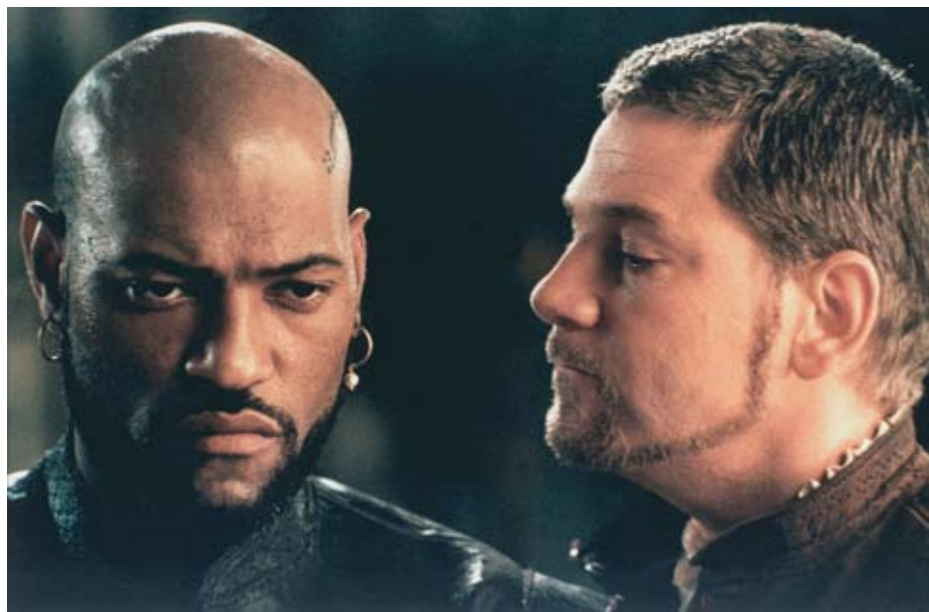
Kenneth Branagh (t.h.) i "Othello"