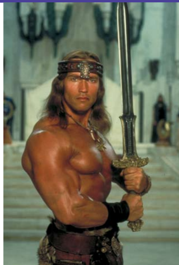
Arnold Schwarzenegger i Conan 2