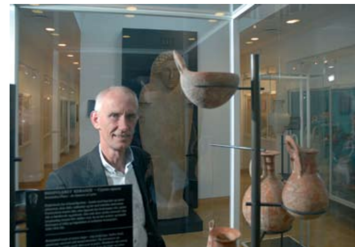
Nationalmuseets direktør viser stolt den antikke samling frem.

som barn. Når man kom ind fra landet med skolen var der 3 ting, man kunne vælge imellem: sejle med turbdæne hernede i kanalen, komme på Carlsberg eller komme på Nationalmuseet. Og vi var sgu ikke ret mange, der valgte Nationalmuseet! Jeg håber, at de børn, der kommer her nu, får en større oplevelse. Det skyldes også måden, hvorpå