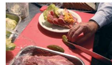
Smørrebrødet tilberedes omhyggeligt.