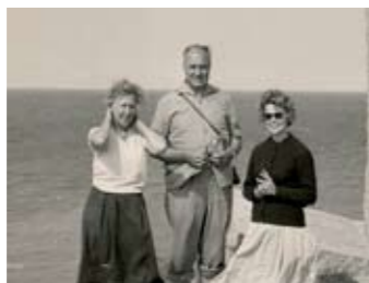
Tante Yvonne, onkel og min kone ved Point du Hoc.

til Finland, og mens onkel Rus gjorde sig i det enorme russiske zarrige, var med til at anlægge det transsibiriske telegrafkabel med en afstikker til Shanghai