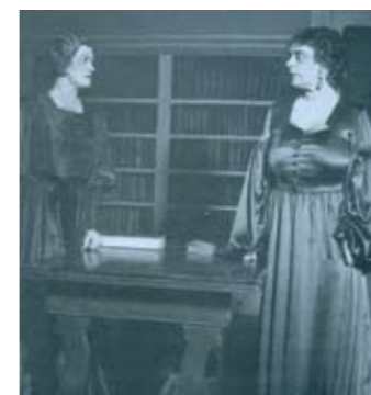
Bodil Ipsen og Betty Nansen, 1933.

Betty Nansen fik publikum til at ligge næsegrus for sine fødder, hun var en stor diva, og man sagde om hende, at hun kunne få en stol til at spille teater. Der kom tilbud fra Nordisk Film om at spille med i såkaldt "litterære" film, og hun indspillede 9 film, bl.a. "Revolutionsbryllup". Hun fik også forhandlet en kontrakt på plads med Fox Film Company i USA, men desværre er alle disse film gået tabt. Hun vendte hjem i 1916, fast