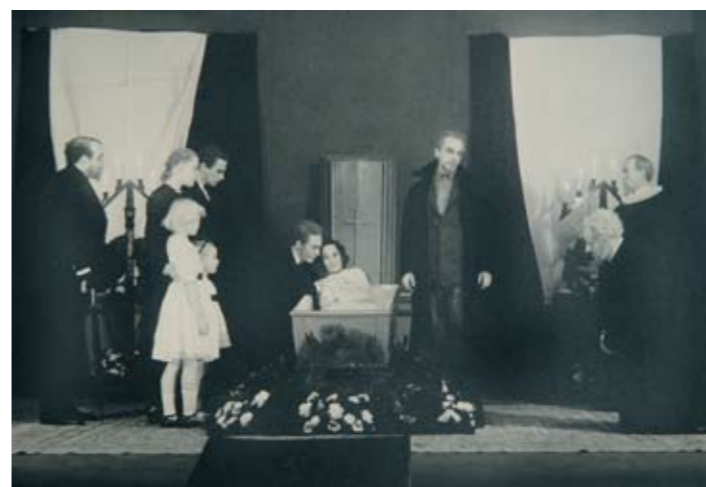
Skuespillet Ordet fra Betty Nansen teatret, 1939.

stive hierarki. Hun var vant til privatteatrenes mere frie liv og trivedes ikke på Kgs. Nytorv, så vejen gik til Dagmar-teatret og Folketeatret, kun afbrudt af mange og lange gæstespil i udlandet.