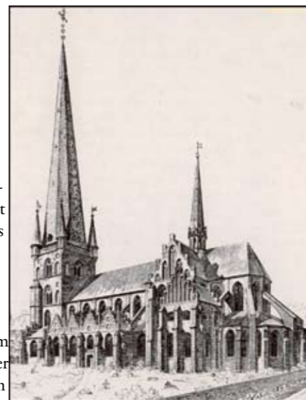
Den tidligere Vor Frue Kirke.

Han bor i Pustervig oppe under taget, og en af hans yndlingsbeskæftigelser er at kigge mod stjernerne og drømme om storhed. Men alle hans drømme