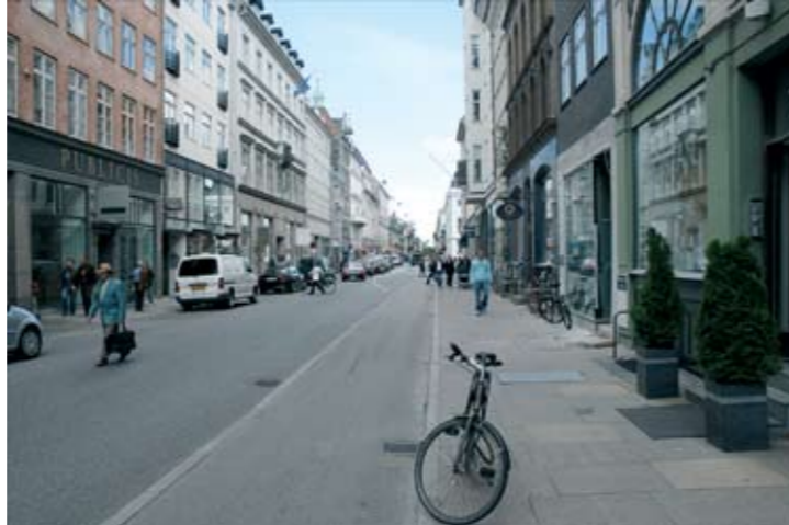
De store palæer der præger Bredgade.

pengekasse, og den påbegyndte kirke lå i over 100 år hen som en ruin, indtil finansmanden C.F. Tietgen købte tomt og selv finansierede færdiggørelsen. Bredgade var og er den fine hovedgade i den fornemme Frederiksstad. Gaden kaldtes i folkemunde "bredgade", fordi den var betydeligt bredere end de omliggende snævre stræder