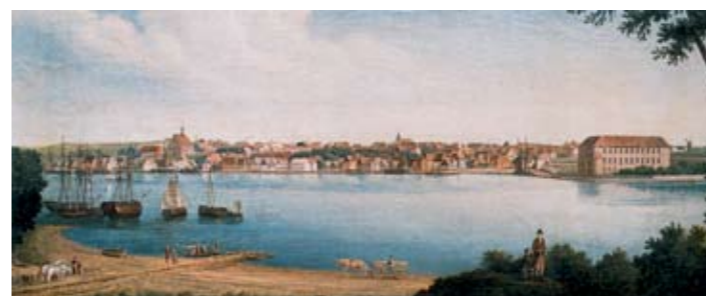
Sønderborg med slottet til højre.

Herman Bang skrev den første egentlige københavnerroman "Stuk" og gav her sit pessimistiske billede af den ny tid i en flimrende og impressionistisk form.