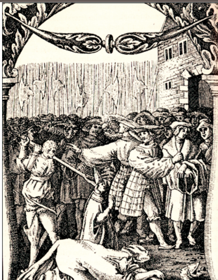
Bodlerne er igang i Stockholm og blodet flyder.

den tjener, vi ser på det gamle Blochske historiemaleri af kongen i fangenskab på Sønderborg Slot. Det maleri, som mange "modne" danskere vil huske fra deres Danmarkshistorie i skolen.