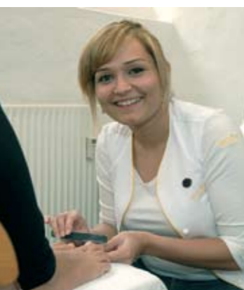
Selay er igang med arbejdet.