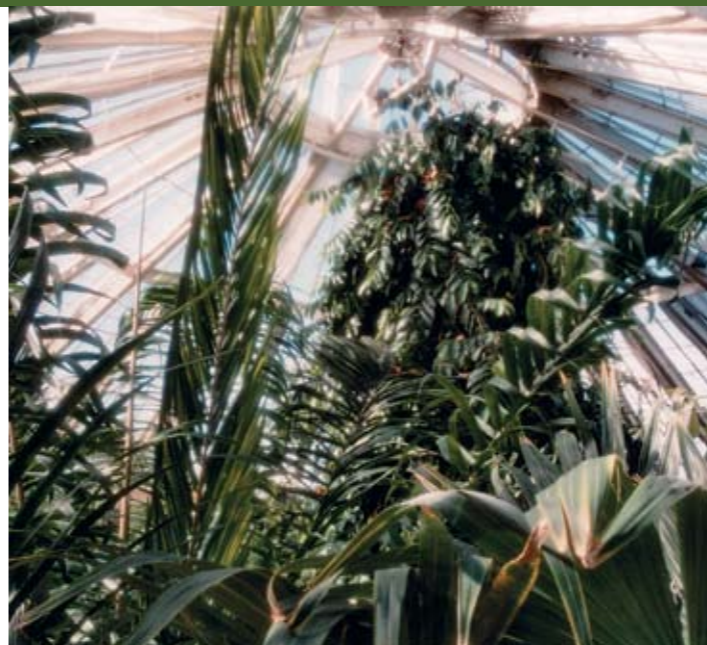
Væksthuses interiør med de mange sjældne planter.

Litterære byture, se: www.peter-og-ping.dk