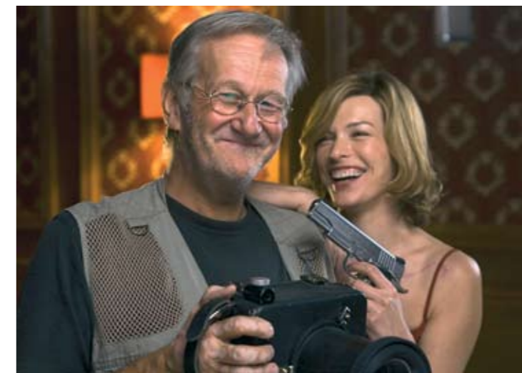
Sammen med Milla Jovovich i Resident Evil.

”Ja, det er der, fordi holdet er kæmpestort, når vi er i udlandet. Der er måske 150 mennesker, hvor vi her i landet kun er 30-40. Og så bruger de mange flere billeder i udlandet, det betyder mere for dem, end det gør her i Danmark. Stillbilledsætten her i Danmark ender med at blive de her 8 billeder til udhængsskabet og så måske 12 billeder til pressen, hvor sættet i udlandet ligger på 135-200 billeder, når filmen er færdig. Sidste år arbejdede jeg på ”Resident Evil III”, hvis oplæg er et computerspil. Milla Jovovich har hovedrollen i filmen. Fra denne film, som har