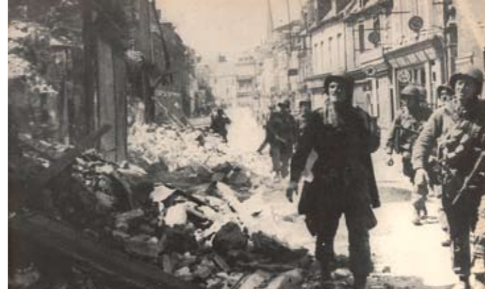
Amerikanske soldater i Cherbourg.