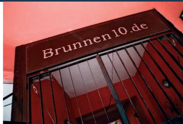
Indgangen til galleriet der havde maleren Poul Gernes udstillet.

så hele det liv kan vi slet ikke rumme på ambassaden, men vi er behjælpelige med at skaffe kontakter til de danske kunstnere, der gerne vil udstille her. Ambassaden har en omfangsrig kulturkalender, hvor vi bl.a. har lister over gallerier, der kunne være interessante for danske kunstnere. Der er så meget gang i det her område, at vi for ca. 2 år siden begyndte at arbejde på ideen med at skabe et tættere netværk mellem danske kunstnere herved. Det er der kommet en hjemmeside ud af, hvor danske kunstnere kan oprette en profil, hvor de kan præsentere sig selv og deres projekter.