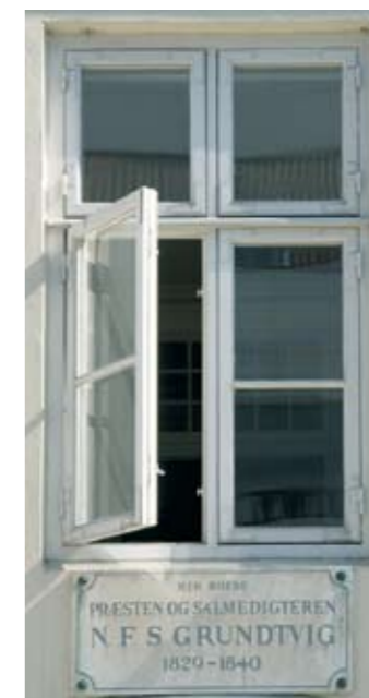
Bag vinduet her har Grundtvig kunnet sidde og se Christianshavnernes travle liv.

En anden berømt person finder vi i Strandgade 6: søhelten