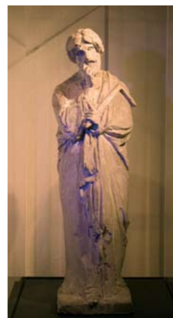
Modeller af fire af apostlene. Skulpturerne blev bestilt til Vor Frue Kirke.