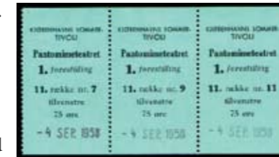
Billetter til forestillingen "Harlekens fægtemester"

lingen starter. Man må nok sige, at den gode Volkersens evner som Pjerrot var større end hans talent