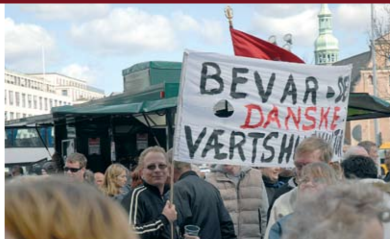
Mange værtshusejere og sympatisører var på gaden til demonstration for bevarelsen af den danske værtshuskultur.

”Sorgenfri bliver røgfri nu. Til gengæld tror jeg nu nok, at folk vænner sig hurtigt til det. Rygning er jo en dårlig vane. Jeg ryger selv, og jeg synes da også, det er en dårlig vane, og jeg går altid udenfor og ryger for ikke at genere andre. Man behøver ikke sidde og ryge folk op i hovedet hele tiden.” Du sagde også, at du