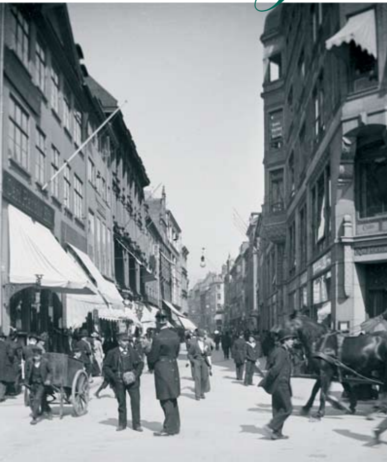
Her står vi på Amagertorv anno 1896 og kigger ned ad Østergade mod Bremerholmen. På hjørnet ses Café Royal og man får en fornemmelse af livet i byen dengang.