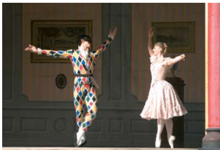
Harlequin og Columbine danser her i Kassanders stue