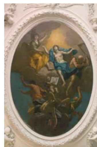
Her ses en del af loftet i Strandgade 6, hvor Tordenskiold boede.

Føljetonen om vores gader og stræder fører os denne gang til Christianshavn og Strandgade.