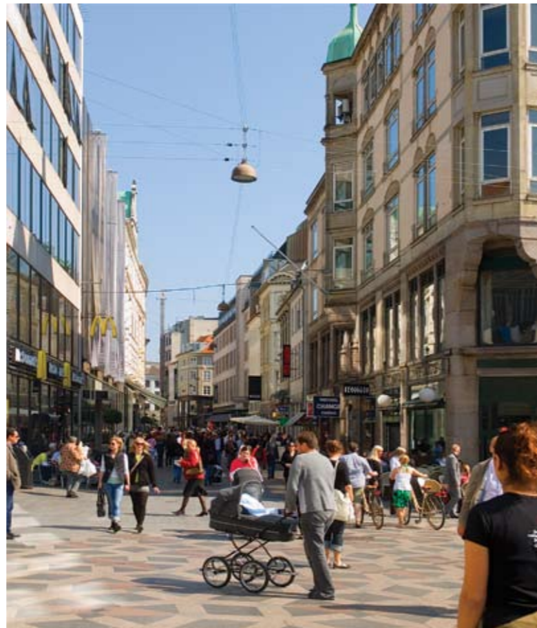
Strøget, som vi kender det i dag, med mange mennesker på en forårsdag. Café Royal er blevet til Café Norden og på den anden side af gaden har Illum og Mac Donalds overtaget.